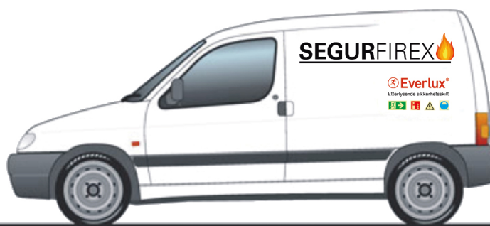
segurfirex – fiktiv bedrift

Bruk av Sinalux- og Masterlux-bilder på internettsider er kun tillatt for bedrifter som forhandler varemerkene.